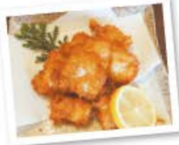
絶品! 能登フグの唐揚げ 820円