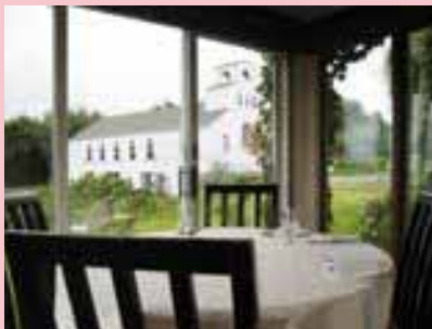
↑店内から望むブドウ畑とチャペル

風景のような景色を眺めながら食事ができるレストランです。欧風田舎料理を基本とした、月ごとに変わるコース料理は特におすすめ。取材の日にいただいた9月のコース料理は、茄子とうなぎの