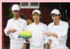
↑リビックカーくんとスタッフの皆さん