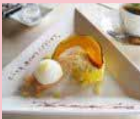
↑感謝の言葉を添えたデザート

また、テーブルにそっと置かれた手書きのカードやデザート皿に書かれたメッセージなど、スタッフの方々の温かいおもてなしの心・お客様への感謝の気持ちを随所を感じる事が