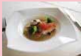
↑秋鮭の生ハム巻き